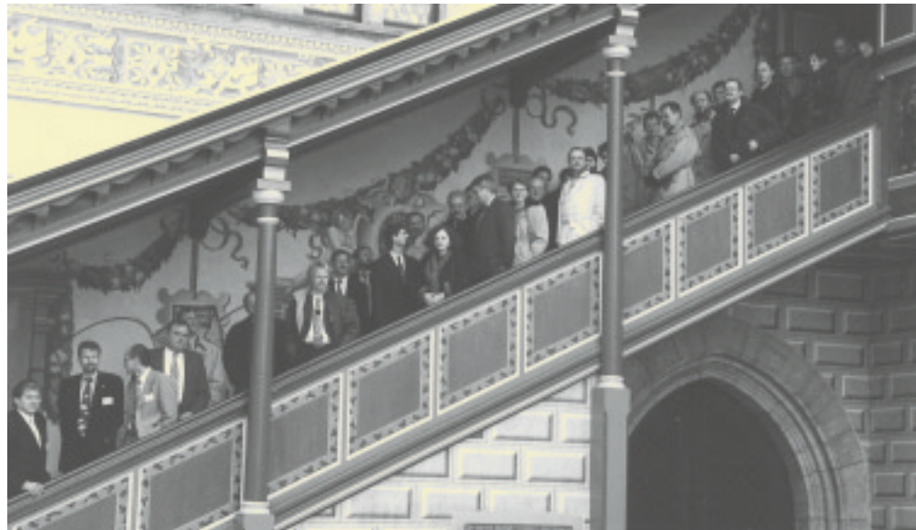
Teilnehmer des SGML-Forums auf dem historischen „Verkünderker“ des Alten Lindauer Rathauses

Mehr und mehr wandelt sich SGML – Standard Generalized Markup Language – vom Schlagwort zur Philosophie in der technischen Dokumentation. In immer mehr Unternehmen fragen sich die für die Dokumentation Verantwortlichen: Sollen wir auf die Karte „SGML“ setzen? Jetzt schon oder erst später? Was haben wir überhaupt konkret davon? Wie groß ist der Aufwand, und wie schnell haben sich die Anlaufkosten amortisiert?