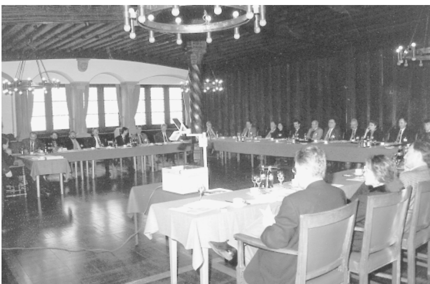
Prächtiges Ambiente für eine prächtige Idee – der Große Saal des Alten Rathauses beherbergte das SGML-Forum

Und nun die Antwort: Wenn Sie Ihre Dokumentation mit SGML strukturieren, können Ihnen diese Fragen fast