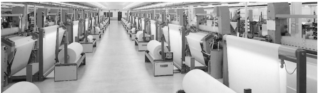
Durchrationalisierter Websaal mit DORNIER Webmaschinen