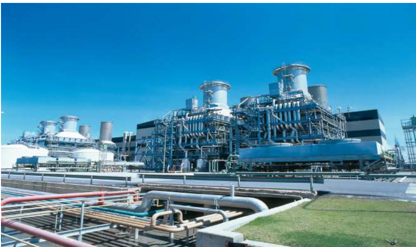
Parallel zur Anlagenentstehung – von der Planungsphase bis zur Betriebsbereitschaft – vergehen auch für die begleitende Dokumentation oft einige Jahre.

Ein Dokumentationsprojekt wird vor allem dann plangemäß verlaufen, wenn die Beteiligten frühzeitig über das notwendige Know-how im Zusammenhang